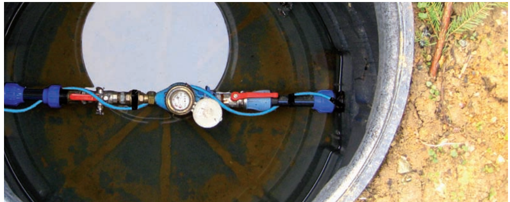
Šachta na vodoměr na hlavním přívodu pitné vody pro RD