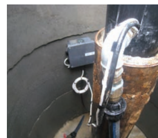
použití hladinového spínače ve studni